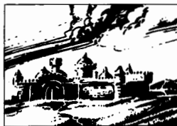
Paragrafi di Specularum, p. 12