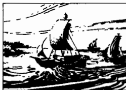
Paragrafi delle rotte commerciali, p. 23