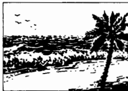
Paragrafi costieri, p. 22