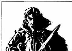
Lathan mano-di-lancia, p. 10