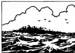
Paragrafi di esplorazione delle isole, p. 18