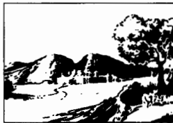
Paragrafi cittadini, p. 16