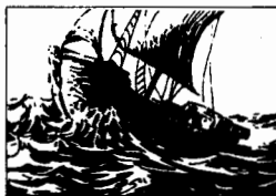
Paragrafi di viaggio, p. 25